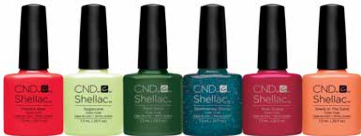
MAMBO BEAT CR91583