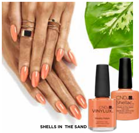
SHELLS IN THE SAND