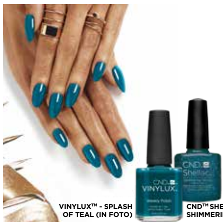
VINYLUX™ - SPLASH OF TEAL (IN FOTO)