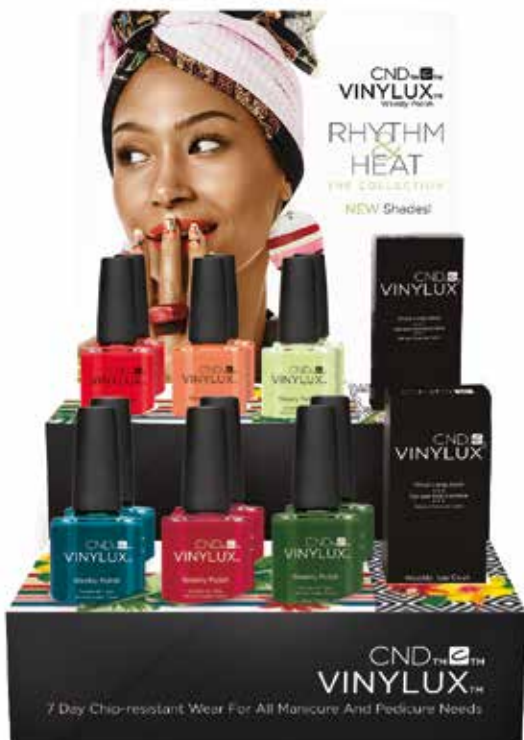
CODICE VINYLUX™ RHYTHM & HEAT COLL. 14 PZ - CR91637