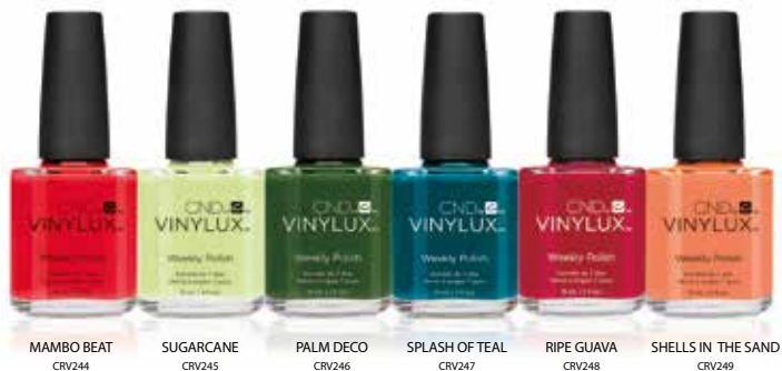
MAMBO BEAT CRV244